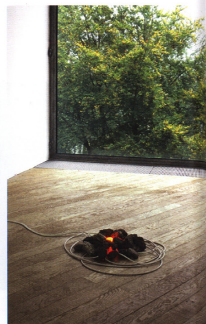
Bag of Bones , 2007. Volcanic stones, neon, cable, 3000V.

Die Arbeit Black Light (For Ten Performers) ist wohl ihr bisher immateriellstes Projekt. Es wurde für zehn Sammler entwickelt. Die Teilnehmer wurden gebeten, eine elektrische Zeitschaltuhr für eine begrenzte Zeit zu installieren. Diese war ferngesteuert und manifestierte sich über eine Reihe synchronisierter Stromausfälle über einen Zeitraum von 12 Monaten hinweg. Als Nachlass dieser Prozesse wird Canell die Reihe von Briefen ausstellen, die jedes Mal an die Teilnehmenden geschickt wurden, wenn es einen Stromausfall gegeben hatte. Diese Briefe hielten den genauen Zeitpunkt sowie das Datum der Stromausfälle in ihren jeweiligen Haushalten fest. Zusätzlich befindet sich ein aus Kabelresten zusammengesetzter Kreis in der Ausstellung, die die Teilnehmer aus den Stromnetzen in ihren Haushalten entfernt hatten. Übersetzt aus dem Englischen