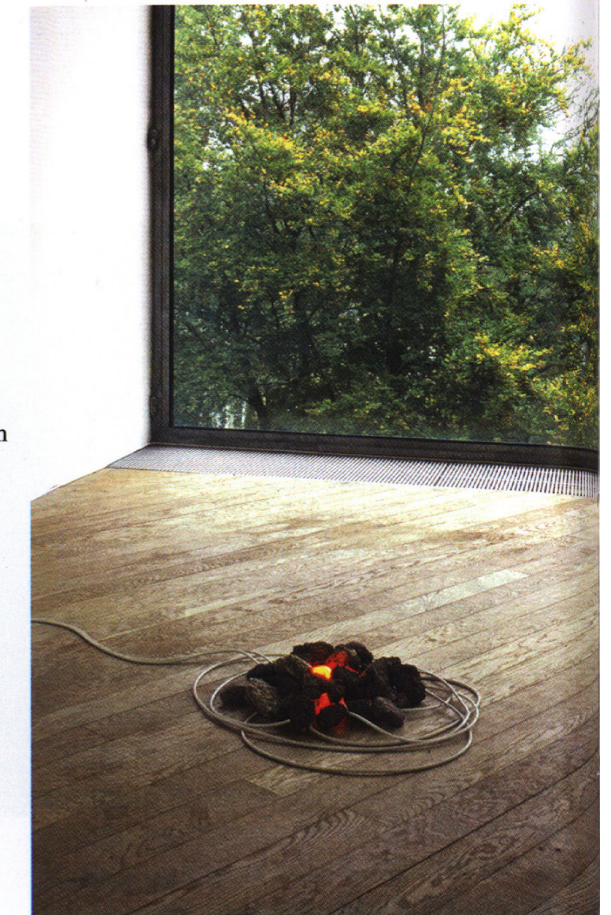
Bag of Bones , 2007. Volcanic stones, neon, cable, 3000V.

Die Arbeit Black Light (For Ten Performers) ist wohl ihr bisher immateriellstes Projekt. Es wurde für zehn Sammler entwickelt. Die Teilnehmer wurden gebeten, eine elektrische Zeitschaltuhr für eine begrenzte Zeit zu installieren. Diese war ferngesteuert und manifestierte sich über eine Reihe synchronisierter Stromausfälle über einen Zeitraum von 12 Monaten hinweg. Als Nachlass dieser Prozesse wird Canell die Reihe von Briefen ausstellen, die jedes Mal an die Teilnehmenden geschickt wurden, wenn es einen Stromausfall gegeben hatte. Diese Briefe hielten den genauen Zeitpunkt sowie das Datum der Stromausfälle in ihren jeweiligen Haushalten fest. Zusätzlich befindet sich ein aus Kabelresten zusammengesetzter Kreis in der Ausstellung, die die Teilnehmer aus den Stromnetzen in ihren Haushalten entfernt hatten. Übersetzt aus dem Englischen