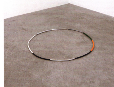
Black Light (For Ten Performers) , 2009—2010. Electric cable (removed from ten households), phosphorescent shrink-tube. Ineke Collection, Aachen.

Nina Canell (geb. 1979 in Växjö, Schweden) lebt und arbeitet in Berlin. Sie studierte am Dún Laoghaire Institute of Art, Design and Technology in Irland. Jüngste Einzelausstellungen u.a.: Ode to Outer Ends , Kunsthalle Fridericianum, Kassel (2011), To Let Stay Projecting As A Bit Of Branch On A Log By Not Chopping It Off , MUMOK Museum Moderner Kunst, Wien, (2010/2011), Kunstverein Hamburg, und Paradise [31] , The Douglas Hyde Gallery, Dublin (2009), und Institute of Contemporary Arts, London (2008). Teilnahme an Gruppenausstellungen u.a.: On Line — Drawing Through the 20th Century , The Museum of Modern Art, New York, Touched — 6th Liverpool Biennial , Tate Liverpool, und Modernauställningen , Moderna Museet, Stockholm (2010), 7th Gwangju Biennial (2009) und Manifesta7 Trentino — South Tyrol (2008). Canell erhielt 2009 den Baloise Kunstpreis auf der Art Basel und 2010 den Kunstpreis Ars Viva.