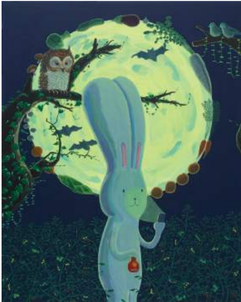
"A Circle of Vegetables around the moon", 2020, acrilico su tela / acrylic on canvas, 150x120 cm.