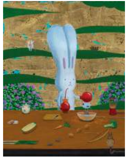
Sopra: / Above: "From Kyoto to Connecticut", 2021, acrilico e foglia oro su tavola / acrylic and imitation gold leaf on board, 41x32 cm.