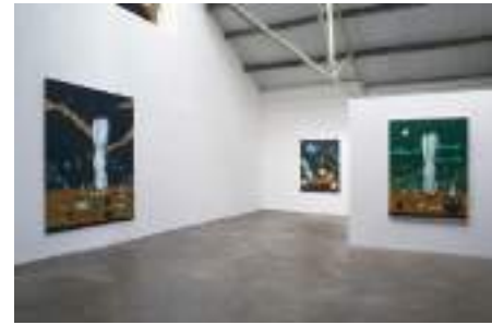
Sopra e sotto: / Above and below: Atsushi Kaga Melancholy with vegetables surrounded by miracles 2020. Installation view

Atsushi Kaga has participated in many one-man and collective exhibitions at a variety of international institutions, including: Irish Museum of Modern Art , Dublin; Powerlong Art Museum , Shanghai; mother's tankstation , London & Dublin; Maho Kubota Gallery , Tokyo; Butler Gallery , Kilkenny; Nicolas Krupp Gallery , Basel; Jack Hanley Gallery , New York; Art Basel Miami Beach with mother's tankstation. Δ